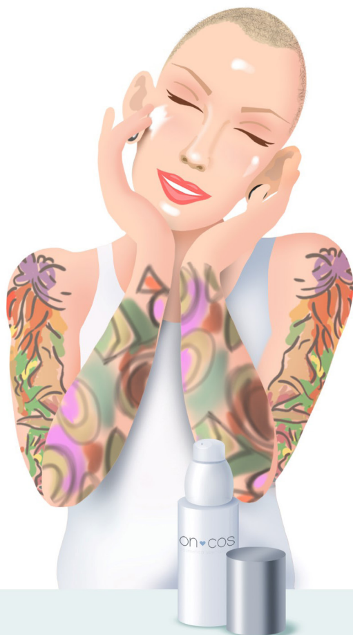
FOTO-PROTEZIONE SPF 50+ PROTETTIVA protegge dai RAGGI UVA e UVB, lenitiva, idratante, calmante.

CREMA VISO ONCOS per combattere la sensazione di prurito, potente lenitivo, calmante con attivi ristrutturanti della barriera cutanea.